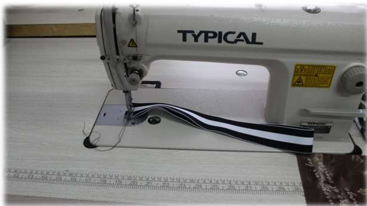
11. Подшить низ боксеров на плоскошовной машине.